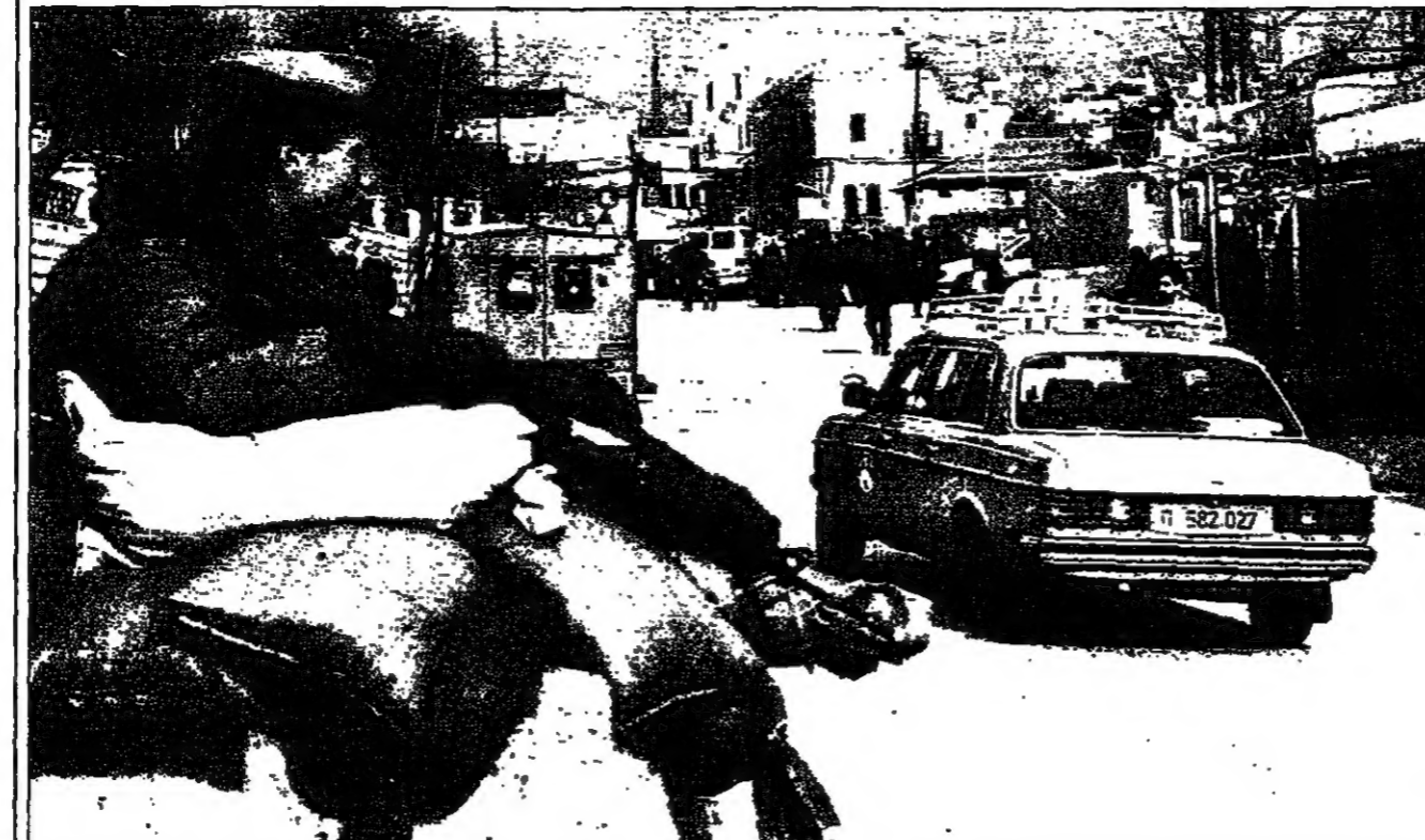
جندي اسراييلي يرافقه شاحنة في مدينة الخليل لدى فتحه أس

■ الرباط - القدس - قال بيرويتز، دوما نائب الرئيس السوري عبد الحليم خدام أمس الثلاثاء في مقابلة مع صحفيين في دمشق، إنه لا يمكن أن يتوقع انسحاب إسرائيل من جنوب لبنان في ظل وجود صواريخ كيميائية في المنطقة. وقال ان حوالي ثلاثين طائرة إيرانية تقل أسلحة كيميائية، عبر مطار دمشق، الحزب الله اللبناني، خلال السنوات الأخيرة، وأضاف ليفي مساء أمس الأول الاسرائيلي يفتخر بفتح سورين صواريخ أرض-أرض تحمل شحنات كيميائية على الحدود مع إسرائيل، وبالتحديد في جنوب لبنان، في مطار دمشق منذ انتهاء عملية عقائد الغضب الاسرائيلية (في لبنان) في نيسان (أبريل) الماضي، ونشر اسم الاثني عشر من صواريخ كيميائية في الدفاع الاسرائيلي حول احتمال قيام اسرائيل بالانسحاب من طرف واحد من المنطقة التي تحتلها في جنوب لبنان بعد مقتل ثلاثة من جنودها في هذه المنطقة خلال الاسابيع الأربعة الماضية.